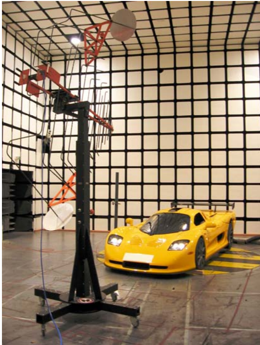
e1 Qualifizierung in EMV Halle