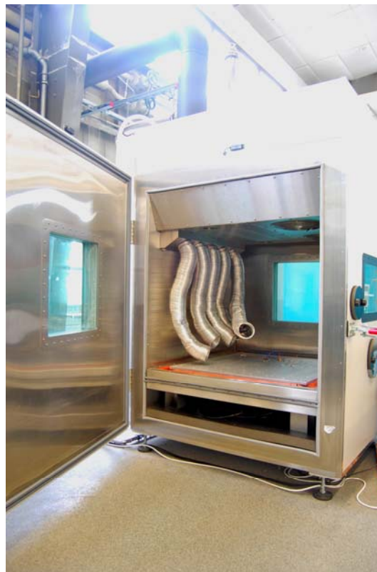
HALT Kammer im SGS Center for Quality Engineering, Standort München, Hofmannstr. 50