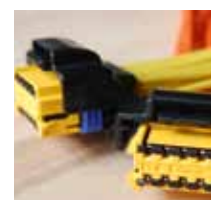
INFORMATION & KOMMUNIKATION