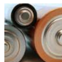
KOMPONENTEN & SYSTEME